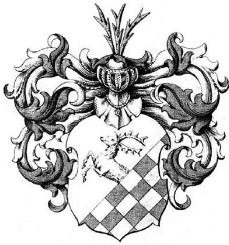
Wappen v. Taunentzien