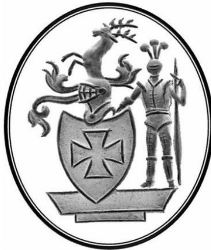
Siegelring (stark vergrößert)